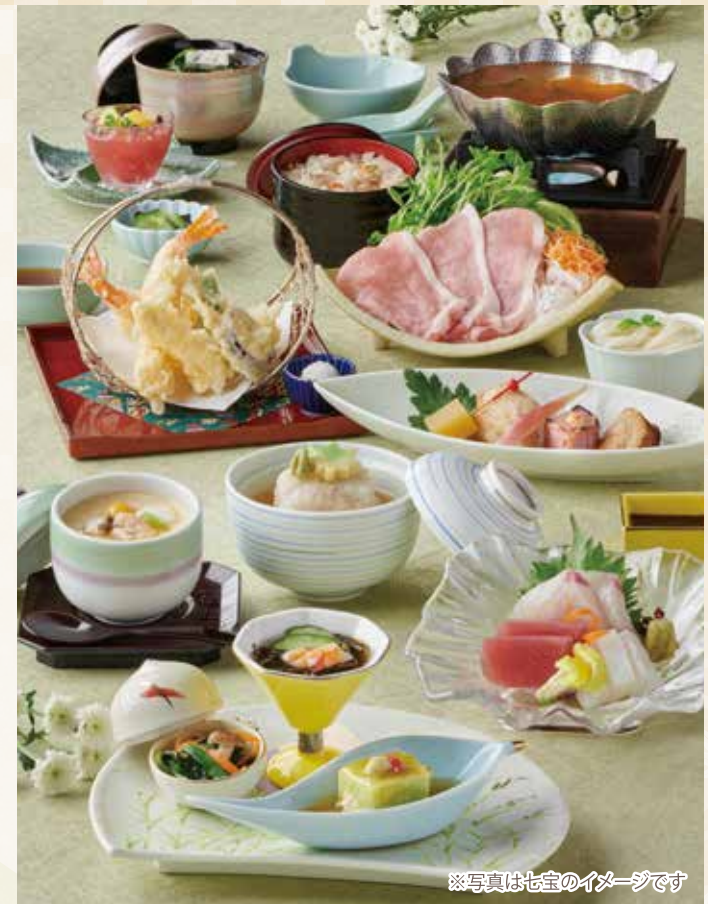
※写真は七宝のイメージです