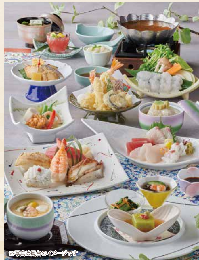
※写真は鳳台のイメージです