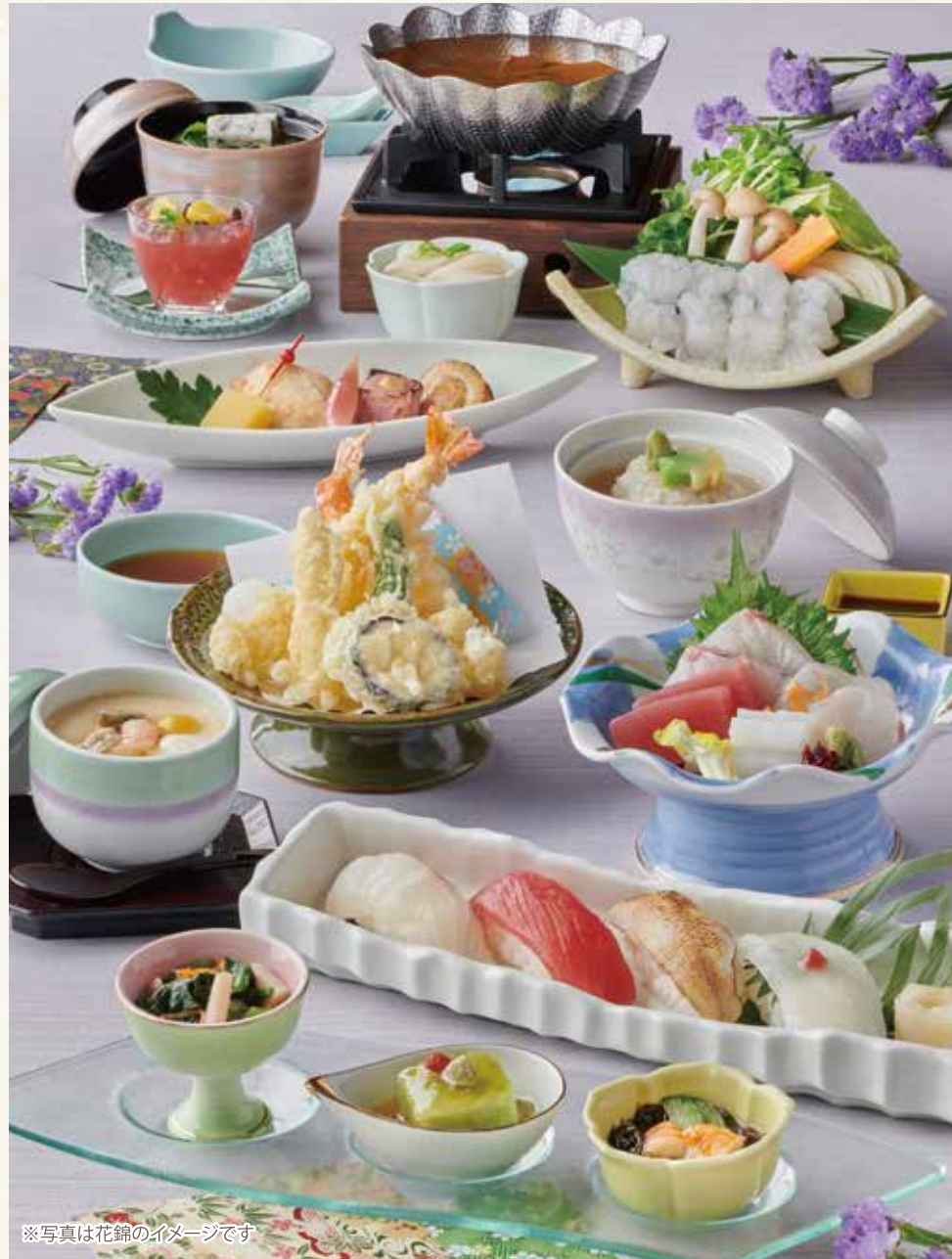
※写真は花錦のイメージです