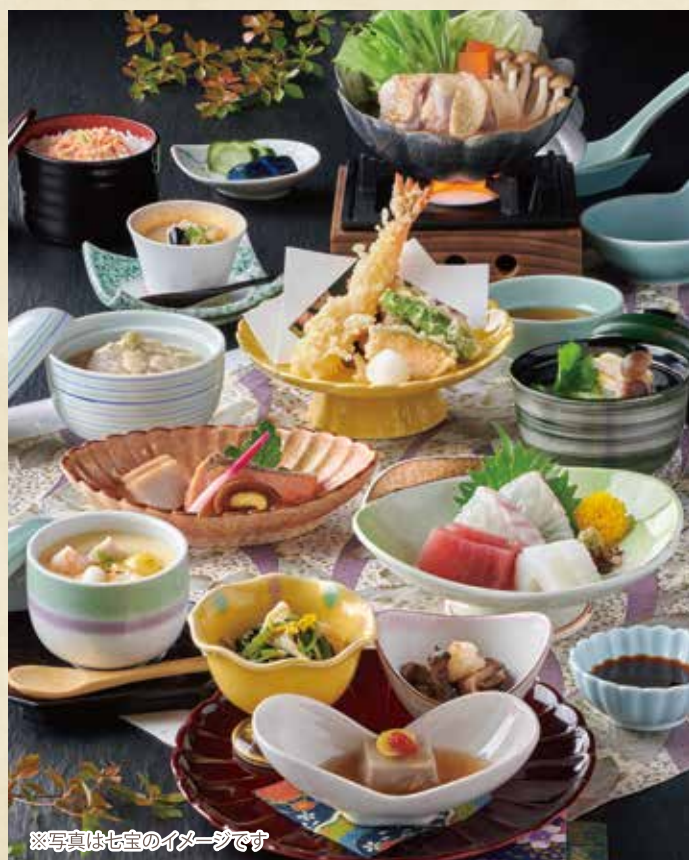
※写真は七宝のイメージです