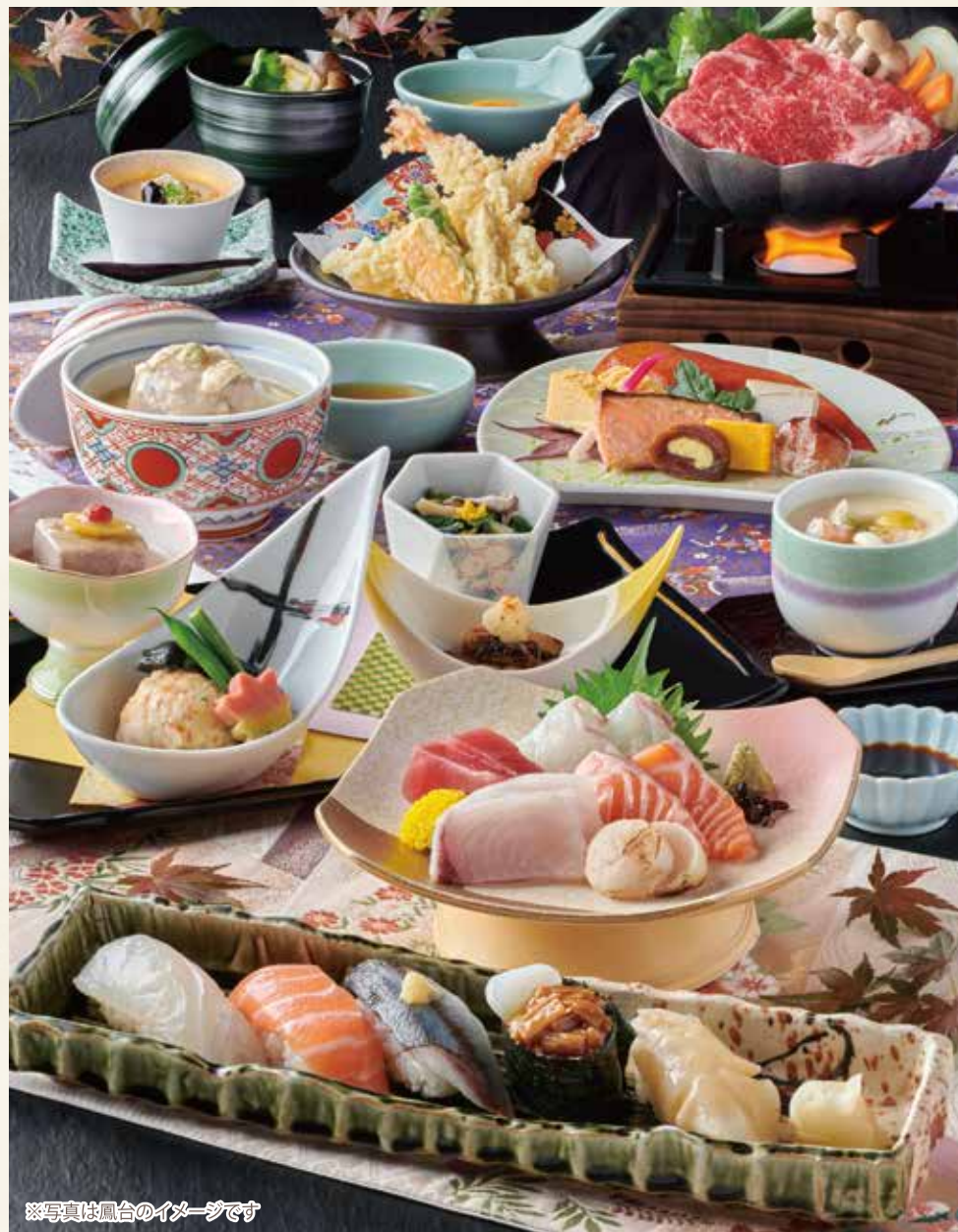
※写真は鳳台のイメージです

旨味にこだわった「出汁」に、旬の食材を活かす職人の「技」。音羽の季節感あふれる味覚会席をご堪能ください。