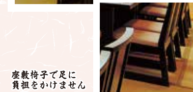
座敷椅子で足に負担をかけません