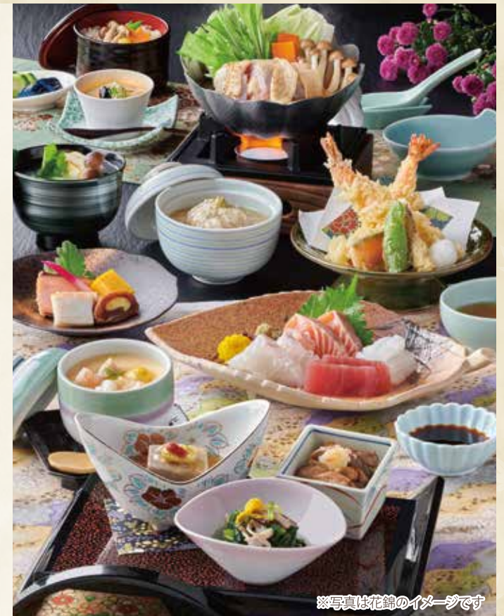
※写真は花錦のイメージです