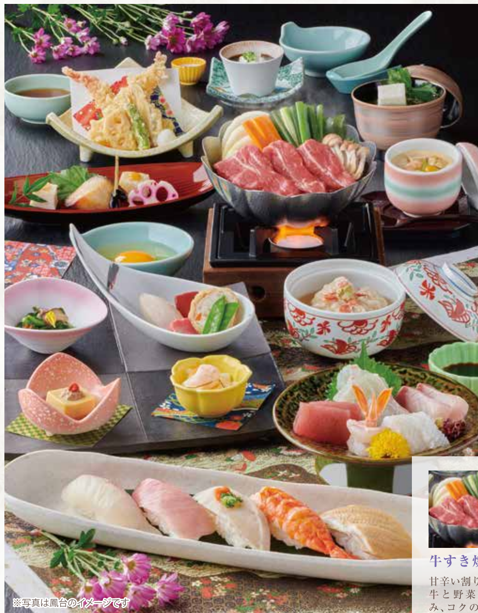
※写真は鳳台のイメージです

旨味にこだわった「出汁」に、旬の食材を活かす職人の「技」。音羽の季節感あふれる味覚会席をご堪能ください。