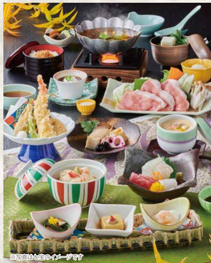
※写真は七宝のイメージです