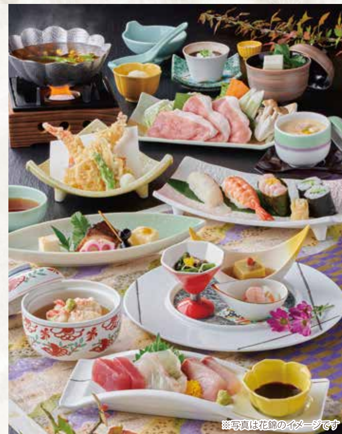
※写真は花錦のイメージです