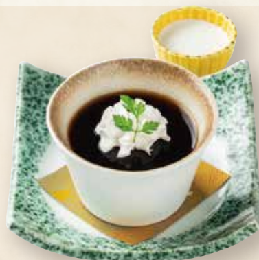
大人の コーヒーゼリー