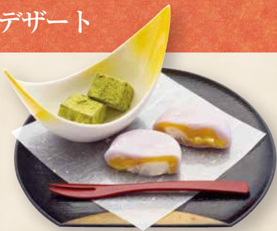
季節の大福と わらびもち