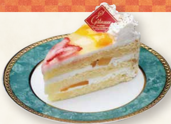
フルーツ ショートケーキ