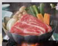
和牛すき焼小鍋 甘辛い割り下が国産牛と野菜に染み込み、コクのある美味しさに。