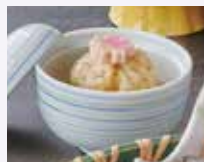
玉ねぎそぼろ饅頭 ～カレー風味仕立て～ 鶏と鰹の合わせ出汁でじっくり練り上げたカレー風味の饅頭です。