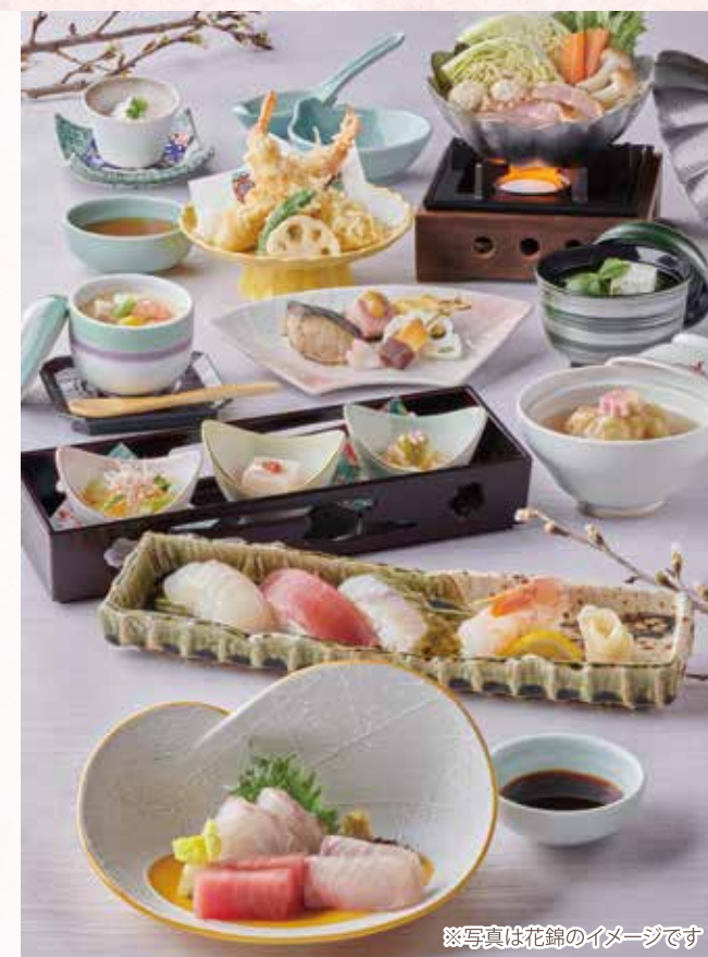
※写真は花錦のイメージです