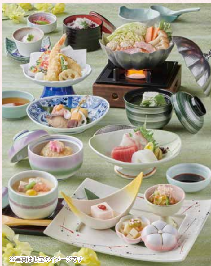
※写真は七宝のイメージです