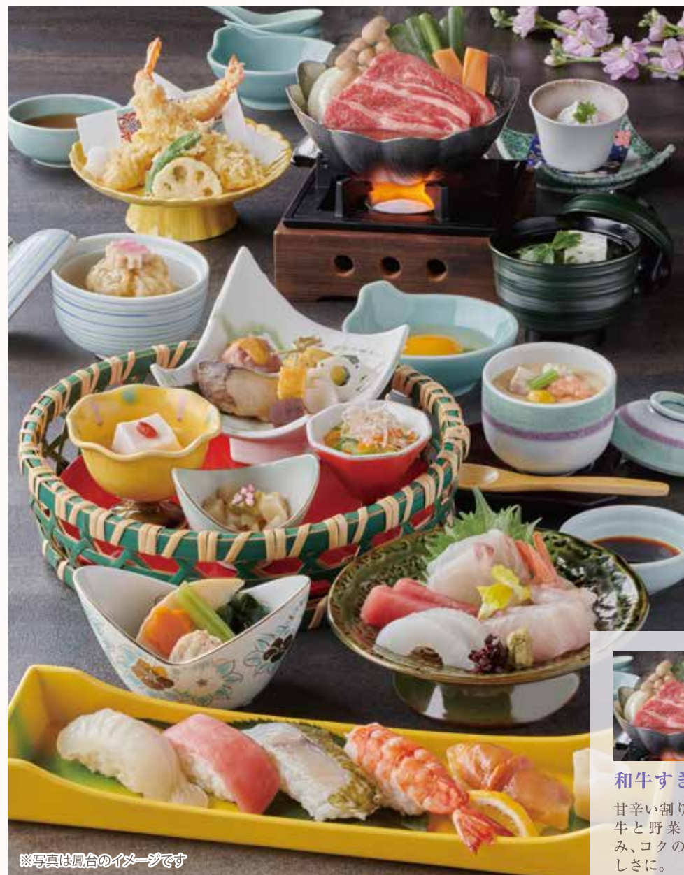
※写真は鳳台のイメージです

旨味にこだわった「出汁」に、旬の食材を活かす職人の「技」。音羽の季節感あふれる味覚会席をご堪能ください。