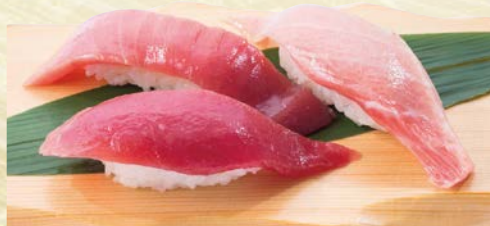
みなみ鮭三昧 870円(税込957円) 赤身・中トロ・大トロ