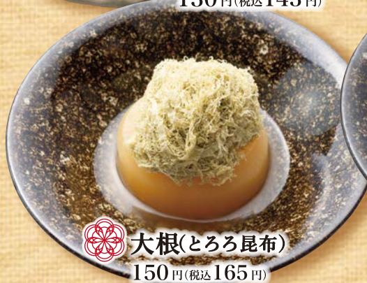
大根(とろろ昆布) 150円(税込165円)