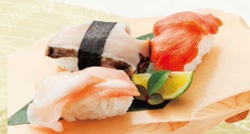
貝三昧 655円(税込720円) つぶ貝・赤貝・あわび