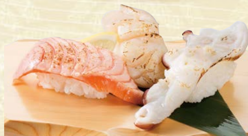
炙り三昧 510円(税込561円) サーモン炙り・ホタテ炙り・生ダコ炙り