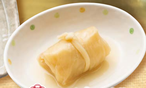
ロールキャベツ 200円(税込220円)