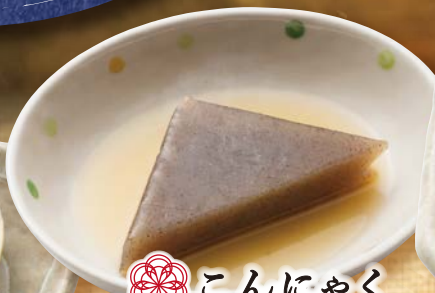
こんにゃく 130円(税込143円)