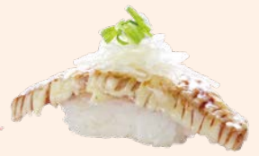
まぐろけんちゃん焼