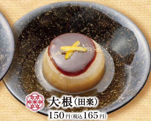
大根(田楽) 150円(税込165円)