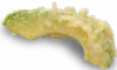
アボカド 140円(税込154円)