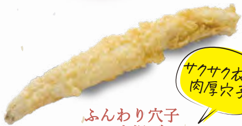
ふんわり穴子 一本揚げ 600円(税込660円)