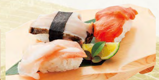
貝三昧 655円(税込720円) つぶ貝・赤貝・あわび