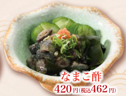
なまこ酢 420円(税込462円)