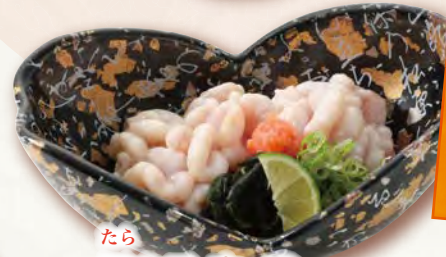
たら 鱈白子ポン酢 620円(税込682円)