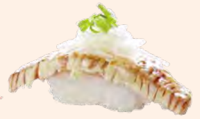
まぐろけんちゃん焼