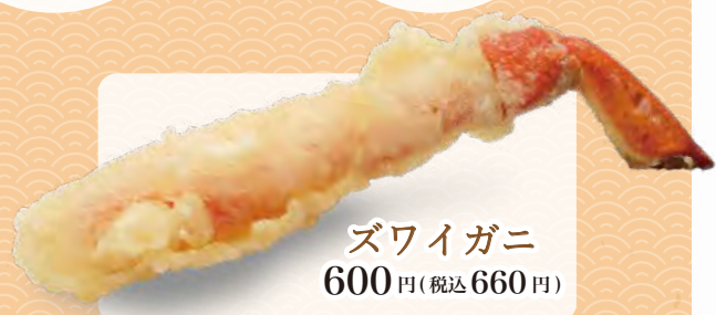
ズワイガニ 600円(税込660円)