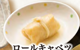
ロールキャベツ 200円(税込220円)