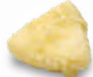
カマンベールチーズ 240円(税込264円)