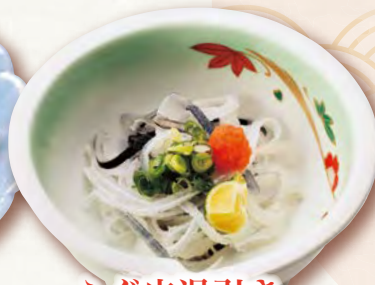
ふぐ皮湯引き 320円(税込352円)