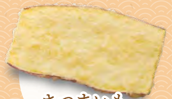
さつまいも 140円(税込154円)