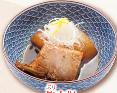
ぶり 鱈大根 420円(税込462円)