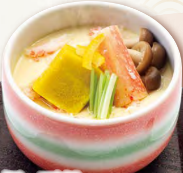
蟹と栗麩の茶碗蒸し 450円(税込495円)