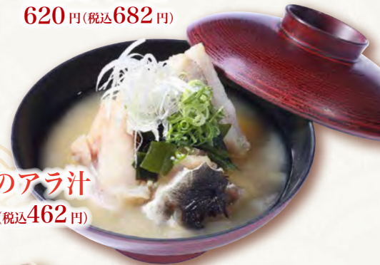
河豚のアラ汁 420円(税込462円)