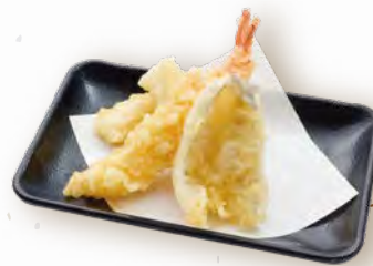
海鮮三種盛り 630円(税込693円) 海老・キス・イカ