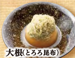
大根(とろろ昆布) 150円(税込165円)