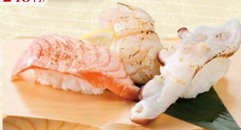
炙り三昧 510円(税込561円) サーモン炙り・ホタテ炙り・生ダコ炙り