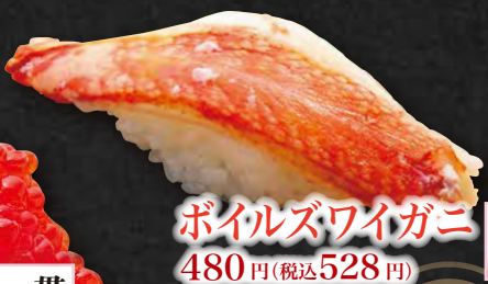
ポイルズワイガニ