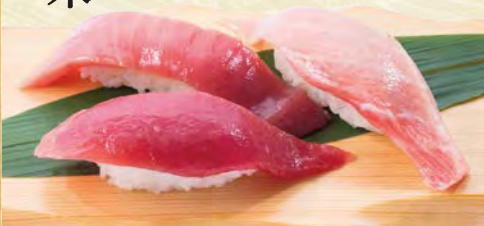
みなみ鮭三昧 870円(税込957円) 赤身・中トロ・大トロ