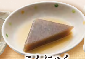
こんにやく 130円(税込143円)