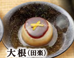
大根(田楽) 150円(税込165円)