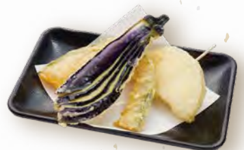
野菜三種盛り 360円(税込396円) 玉葱・茄子・かぼちゃ