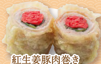
紅生姜豚肉巻き 180円(税込198円)