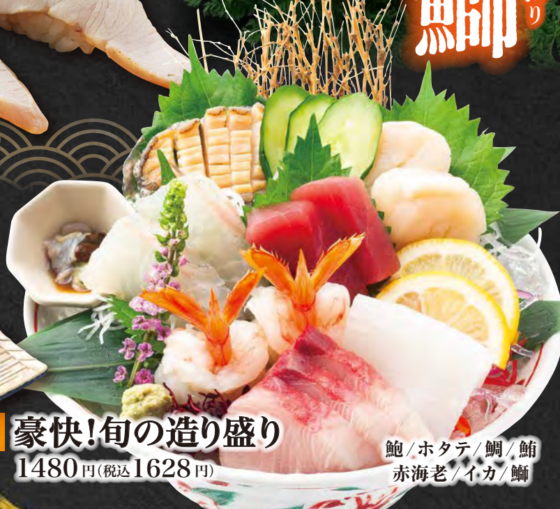
豪快!旬の造り盛り