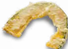
かぼちゃ 120円(税込132円)