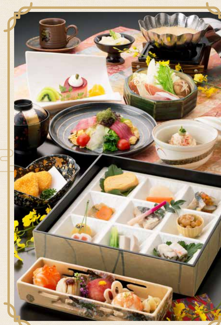
※写真は、「姫室」のイメージです。